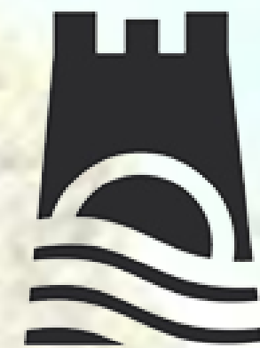
Ayuntamiento de Adeje