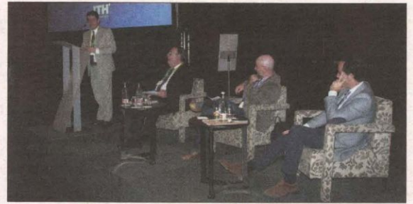
Mesa redonda sobre casos de éxito de productos turísticos sostenibles.