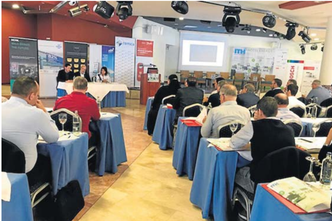
En la imagen, acto de apertura de las jornadas sobre energía en hoteles, organizado por el ITH en el Gloria Palace Royal Hotel de Amadores.