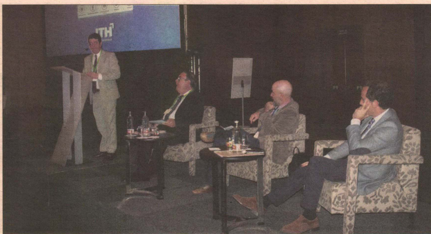
La mesa redonda sobre casos de éxito de productos turísticos sostenibles celebrada en Futuralia.