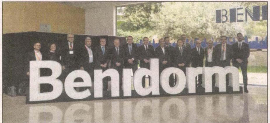
Los miembros de ATM se han reunido tras el acto inaugural del Foro.

Los municipios de la AMT participaron en una de las mesas programadas en el XIX Foro Internacional de Turismo de Benidorm. La inauguración del foro corrió a cargo del alcalde de Benidorm, Toni Pérez; del secretario autonómico de Turismo de la Agencia Valenciana de Turismo (AVT), Francesc Colomer; el rector de la Universidad de Alicante (UA), Manuel Palomar; el presidente de la patronal hotelera Hosbec, Toni Mayor; y el di-