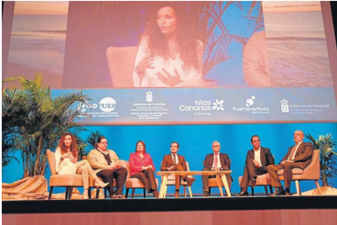
Un momento de la inauguración ayer de la tercera edición del congreso en el Palacio de Congresos de Puerto del Rosario.